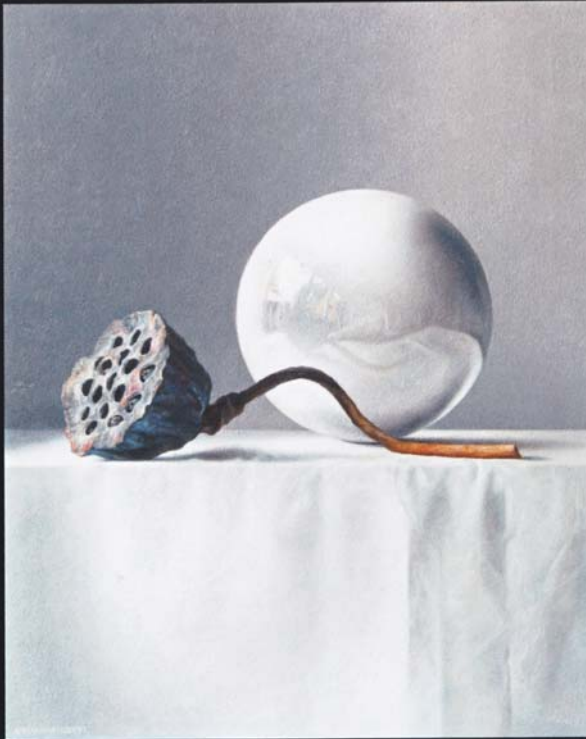
Adriana van Zoest, Vijftig tinten paars met uitgedroogde lotus zaaddoos , 2013, olieverf op paneel, 50x40cm

mij al een schilderij waard. Jarenlang ben ik zo zoekend en ploeterend bezig geweest, totdat ik mijn strijkplank eens na het strijken niet had opgeruimd. Tijdens de verbouwing bleef deze in het atelier uitgekapt staan. Na verloop van tijd had ik er een aantal planken opgelegd en begon er composities op te maken. Ik merkte hoe bruikbaar de traploze hoogteverstelling van de strijkplank voor mij was. En zo was mijn nieuwe tafel geboren.