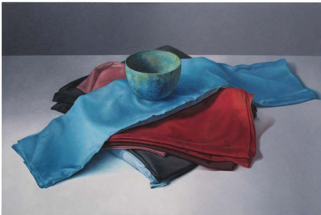
Compositie met de Blauwe Lap , 2010, olieverf op paneel, 80x120cm

De tekening wordt op het paneel aangebracht waarna de tubes verf op mijn palet worden uitgeknepen. Het mooiste moment, het creëren, is begonnen. Nadat de tekening is aangebracht, zie ik het werk al voor me. Ik zal het alleen nog moeten schilderen.