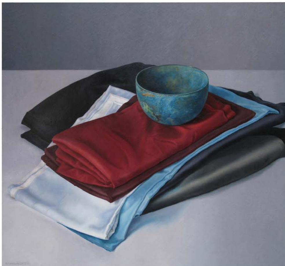
Compositie met de Rode Lap , 2010, olieverf op paneel, 75x80cm